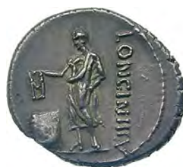
Denar Kasjusza Longinusa z 63 roku p.n.e., przedstawiający mężczyznę w todzie wrzucającego tabliczkę z literą V , która oznaczała głos za ustawą, do wiklinowego kosza

Losowanie odgrywało w rzymskiej polityce istotną rolę w wielu momentach. W przypadku komicji trybusowych ustalało kolejność, w jakiej będą głosowały poszczególne tribus. Kolejność wyznaczona przez los odgrywała często w głosowaniu w komicjach kluczową rolę, gdyż występowało tu zjawisko nazywane dziś przez politologów efektem kuli śnieżnej (ang. bandwagon effect – dosł. efekt wozu z orkiestrą 3) ): przenoszenia przez wyborców poparcia na lidera wyborów czy sondaży, znane tak dobrze z prawyborów kandydatów obu głównych partii w amerykańskich wyborach prezydenckich. Inną ważną kwestią, rozstrzyganą przez losowanie, było coroczne rozdzielanie między senatorów (najczęściej byłych konsulów i pretorów) namiestnictw poszczególnych prowincji, a także innych ważnych zadań, jak funkcje ambasadorów czy dowódców armii.