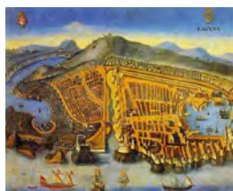
Widok Raguzy przed trzęsieniem ziemi w roku 1667