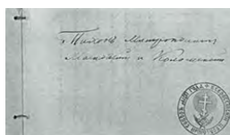
Patriarcha moskiewski i całej Rusi, Tichon (1865–1925), wybrany w roku 1917, oraz los z jego imieniem jako metropolity moskiewskiego i kołomieńskiego użyty w losowaniu decydującym o elekcji