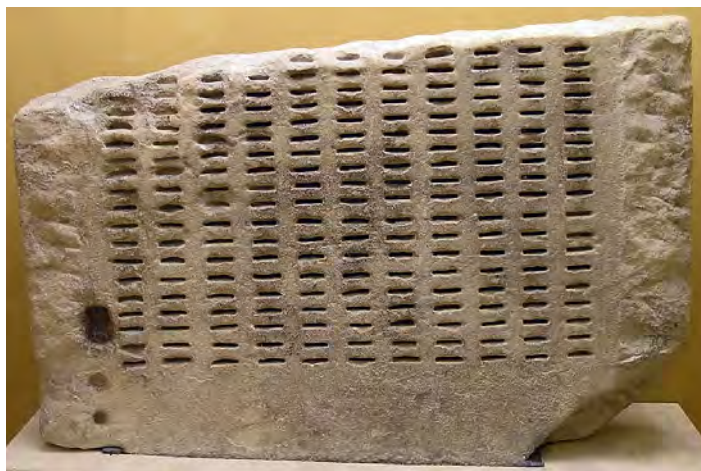
Kleroterion, pinakia oraz kula z brązu. Muzeum Agory

Na skraju ateńskiej agory, czyli starożytnego rynku, wznosi się Stoa Attalosa, świecąca z dala podwójnym rzędem białych marmurowych kolumn, zrekonstruowana w czasach nam współczesnych i mieszcząca bogate zbiory muzealne pochodzące głównie z wykopalisk prowadzonych w XX wieku w tej części Aten . Budynek ten odegrał również pewną rolę w historii Polski – to właśnie tam podpisano w roku 2003 traktat ateński, stanowiący prawną podstawę przystąpienia naszego kraju do Unii Europejskiej. Długa na sto piętnaście metrów i szeroka na dwadzieścia hala, stanowiąca starożytny odpowiednik średniowiecznych czy renesansowych sukiennic, gromadzi dziś świadectwa rozwoju demokracji ateńskiej. Pośród wielu obiektów znajdujących się w muzeum uwagę zwiedzających zwraca dziwny na pozór eksponat – ułamana marmurowa tablica poprzecinana jedenastoma kolumnami wąskich poziomych otworów, przed którą leżą wykonane z brązu równie wąskie plakietki ( pinakia ) z wypisanymi na nich imionami. Ten przyrząd, nazywany przez