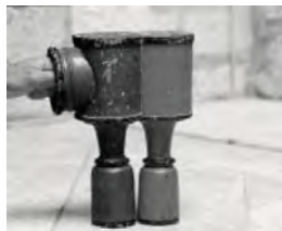
Urna do balotażu z dwiema komorami. Muzeum w Dubrowniku

W roku 1667 rejon Dubrownika nawiedziło straszliwe trzęsienie ziemi, w następstwie którego wybuchł pożar. Zginęło 5000 mieszkańców, w tym urzędujący Rektor, a trzy czwarte budynków w mieście legło w gruzach. Po tej katastrofie Republika Raguzy nigdy już się nie podźwignęła. Choć później również stosowano dawną procedurę wyborczą, to losowania stały się po części tylko symbolicznymi ceremoniami, bo liczba patrycjuszy zmalała tak bardzo, że nie było już niemal wśród kogo wybierać ani elektorów, ani urzędników.