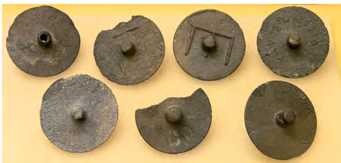
Krążki do głosowania w trybunale: na prawym górnym widnieje napis psefos demosia (żeton publiczny). Sześć z tych krążków oznacza głos za skazaniem, a jeden z wydrążoną tuleją (w lewym górnym rogu) – przeciw

W trybunałach głosowanie było zawsze tajne. W IV wieku p.n.e. każdy z sędziów otrzymywał po dwa krążki wykonane z brązu o średnicy około pięciu centymetrów. Przez każdy krążek przechodziła tuleja, która