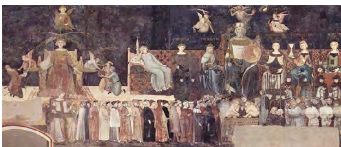
Fragment fresku autorstwa Ambrogia Lorenzetti, Alegoria dobrych rządów , w Sali Dziewięciu ( Sala dei Nove ) w ratuszu ( Palazzo Pubblico ) w Sienie

Swoistą równowagę między pierwiastkiem irracjonalnym (losowaniem) a racjonalnym (głosowaniem), tak charakterystyczną dla ateńskiej polis i republikańskiego Rzymu, można również napotkać w ordynacjach wyborczych obowiązujących w średniowieczu, a także w czasach późniejszych – we włoskich i dalmatyńskich republikach miejskich. Zarówno losowanie, jak i zasada tajności głosowania odgrywały tam podobną rolę jak w starożytności: miały chronić ustrój republikański przed korupcją i nienawiścią, nie dopuszczając do tego, aby w życiu politycznym prywatny interes jednostek i najbogatszych rodów zyskał przewagę nad dobrem publicznym.