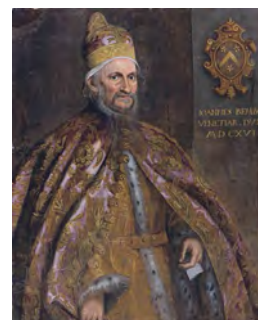
Portrety dożów weneckich: Leonardo Loredano pędzla Giovanniego Belliniego (wyżej) i Giovanni Bembo autorstwa Domenica Tintoretta (niżej)