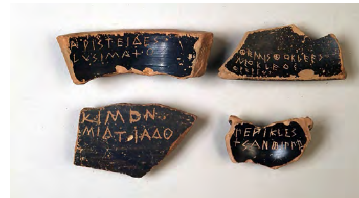
Ostrakony z wrytymi imionami Arystydesa, Temistoklesa, Kimona i Peryklesa

Niegdyś uważano, że za powszechnością losowania jako formy wyłaniania urzędników ateńskich stało przekonanie, że z loteryjnym wyborem wiąże się wola bogów olimpijskich, objawiająca się w ten sposób. Dziś jednak historycy są w tej kwestii podzieleni. Najprawdopodobniej wiara w boską interwencję stała u źródła całej procedury, gdyż, jak zobaczymy dalej, losowanie jako forma podejmowania decyzji było w starożytności stosowane nagminnie nie tylko w Atenach, a twórcy ateńskiej demokracji zapewne jedynie wykorzystali ten archaiczny zwyczaj do swoich celów. Za obsesyjnym niemal łańcuchem wyborczych loterii, absorbującym tysiące ateńskich obywateli przez wiele tygodni w roku, kryło się jednak z pewnością coś więcej niż powszechna wiara w bogów i ich wpływ na ludzkie losy. Ten skomplikowany mechanizm miał bowiem zarówno redukować stopień korupcji (jako że do ostatniej chwili nie wiadomo, który z sędziów będzie orzekać w danej sprawie lub który z obywateli obejmie urząd, a trudno byłoby przekupić zawczasu tysiące Ateńczyków),